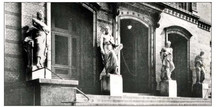
Sie symbolisierten die vier Gründungsfakultäten der Hochschule: Die vier Philosophen zierten bis 1945 das Hauptportal der Universität.